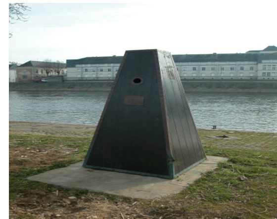
Quai de Châtelleraut : monument commémorant le retour des Acadiens en Poitou