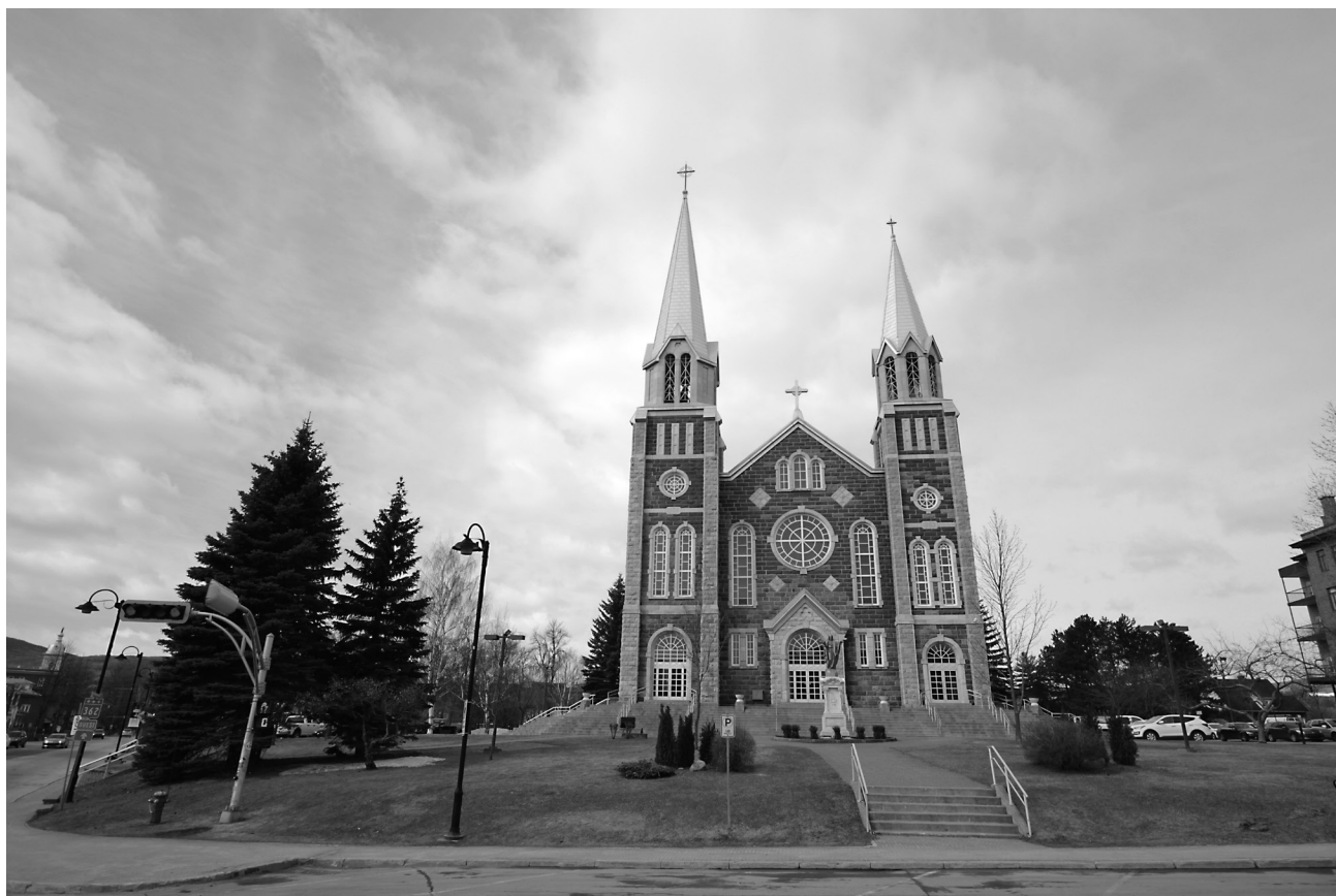
L'église de Baie-Saint-Paul