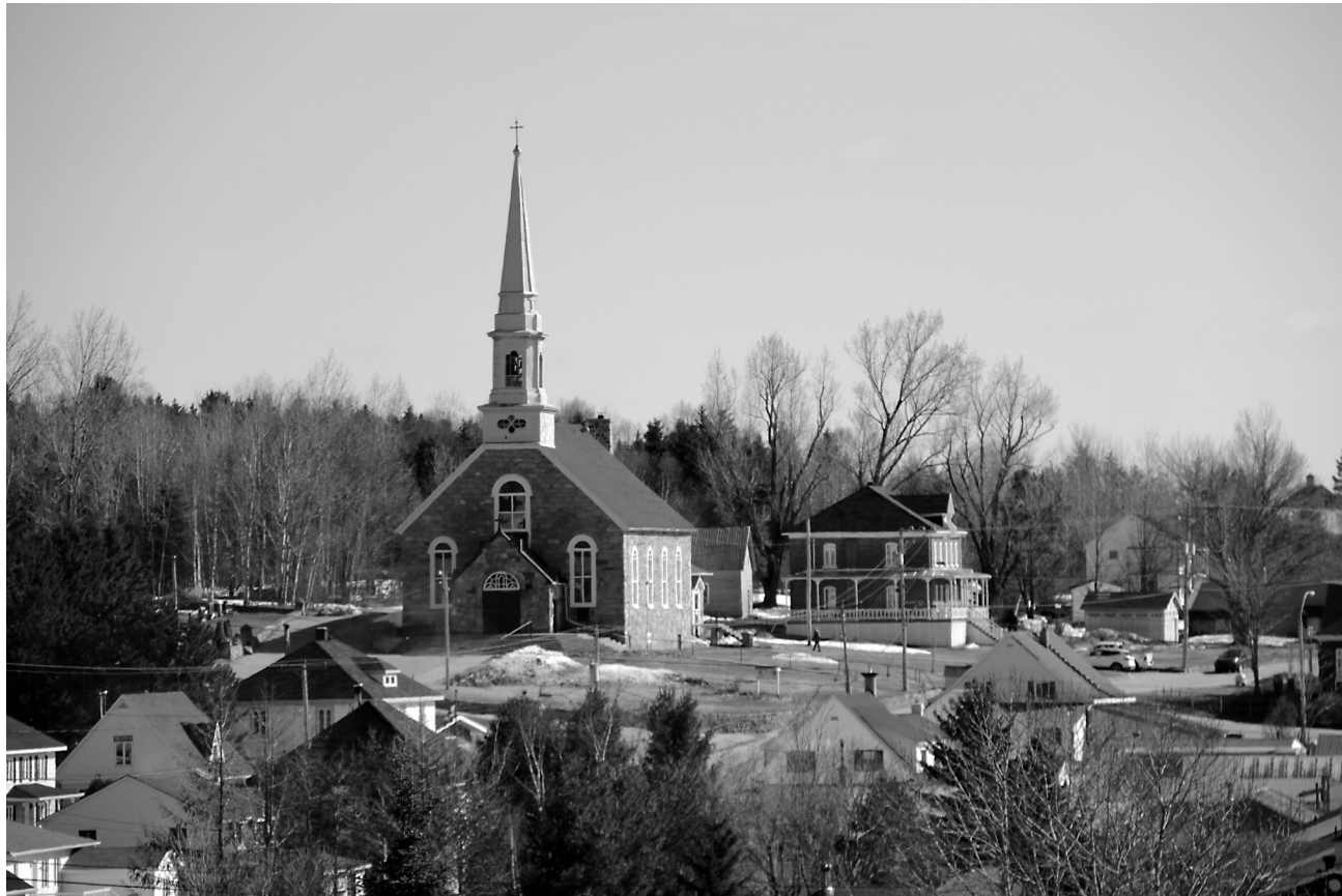
Église de Saint-Fidèle (La Malbaie)