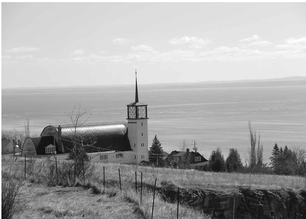
Cité d'Art logée dans l'ancienne église Saint-Raphaël de Cap-à-l'Aigle (La Malbaie)