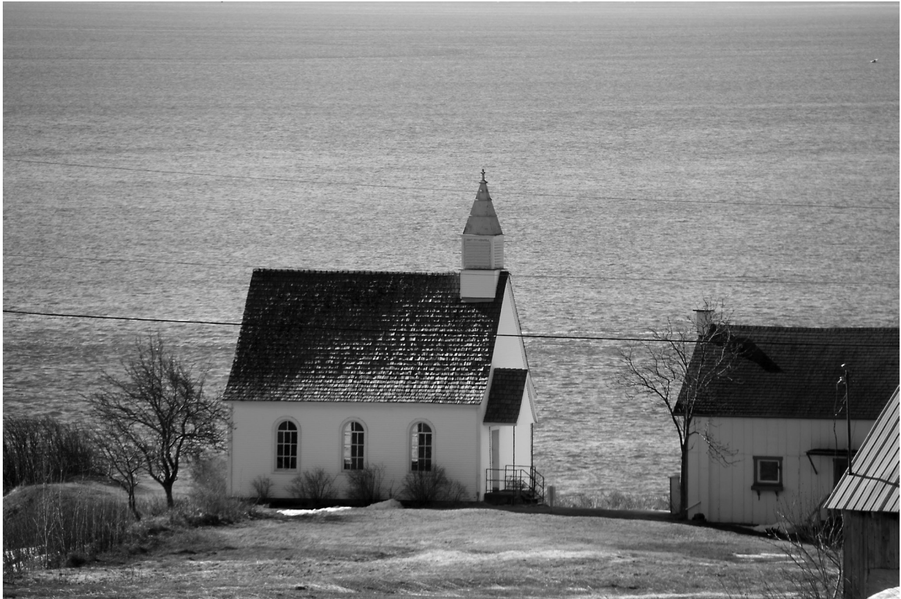
Chapelle presbytérienne Mc Laren de Port-au-Persil