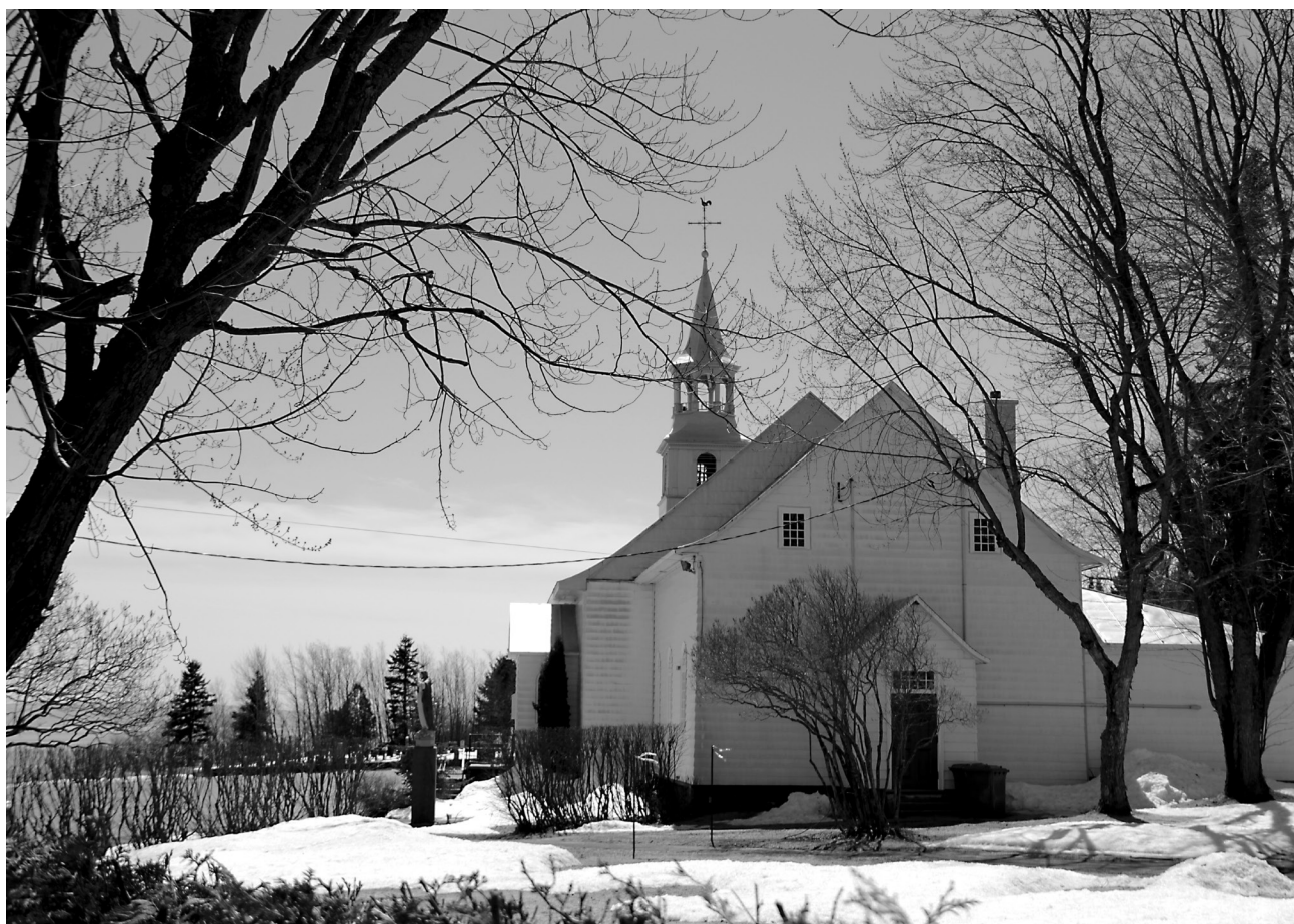
Chevet de l'église de Saint-Irénée