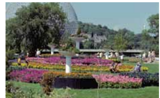
Les 3 images sur cette page : Les Floralies internationales de Montréal.